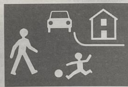
D 49a "Obytná zóna"

Bližší podrobnosti ve vyhl. č. 99/89 Sb. o pravidlech silničního provozu.