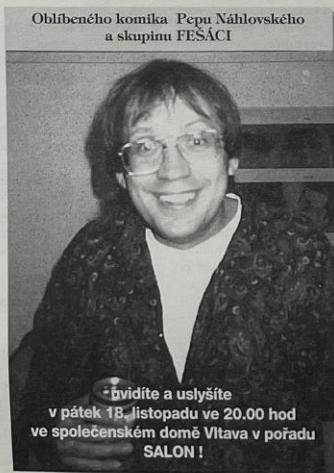
Oblíbeného komika Pepu Náhlovského a skupinu FESÁCI

Víte že, spolupodíloví vlastníci bývalých městských bytových domů mohou učinit prohlášení na katastrálním úřadu Mělník o vložení bytových domů dle zákona 72/94 Sb. Tím se stanou vlastníkem konkrétního bytu a podílu na společných prostorách domu.