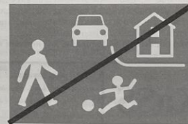
D 49b "Konec obytné zóny"