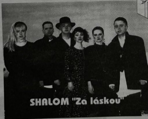
Koncert populární skupiny ve velkém sále společenského domu Vltava ve čtvrtek 8. prosince v 19.30 hod.