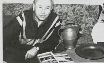
Baculatý cínový korbel přihlíží splnění přání. Tentokrát to byly Kralupy.