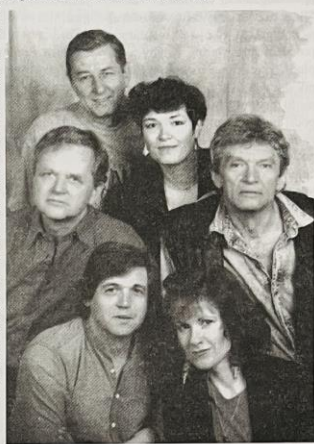
Programové oddělení KaSS

Zároveň se omlouváme všem neuspokojeným příznivcům bratří Nedvědů, na které nebyly vstupenky. Snažili jsme se objednat ještě jedno představení, ale populární písničkáři ze zásady druhé představení odmítají. Na termín tohoto jejich vystoupení jsme čekali dva roky. Nezbývá než doufat, že se nám podaří další jejich koncert získat v termínu kratším.