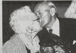
Diamantový svatební polibek "a pořád Tě miluju!"

Co dodat? Snad jen - hodně a hodně zdraví!