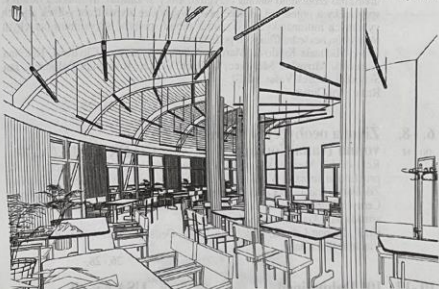
Budoucí interiér jídelny

některými nezbytnými službami. Každý nájemník bude mít svůj byt a bude platit normální nájemné. Nebude to tedy v žádném případě klasický domov důchodců.