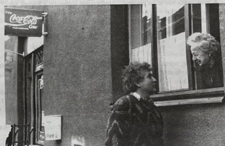
Babička a vnuč - s humorem jde všechno líp !