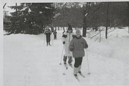
Při jednom z výletů na běžkách.

V cíli bude umístěno stanoviště her a soutěží pro děti. Využijte otevřené restaurace Na baště v podhradí Okoře.