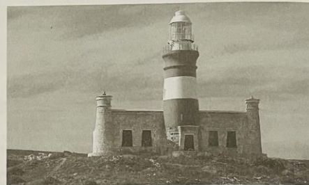
Střílkový mys - nejjižnější bod Afriky.

predstaví divoká zvířata, pralesy a vůbec přírodu. I my jsme chtěli spatřit na vlastní oči volně žijící zvěř a vyrazili jsme tedy do největšího jihoafrického národního parku - Krugeru. Čtyři dny jsme