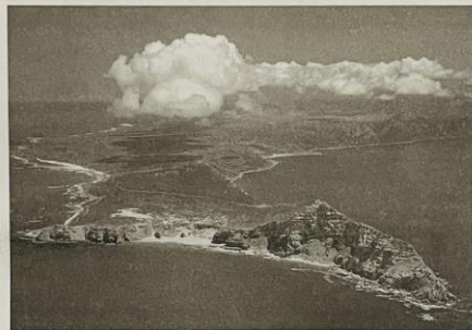
Mys Dobré naděje.

Poslední květnový týden roku 1998 prožíváme v Drakensbergu. To je vysoké pohoří, vlastně ploché stolové hory s nejvyššími vrcholky přes 3 000 metrů, z části obklopující malý samostatný státček Lesotho. Pustili jsme se pěšky do kopců, lezli po žebříčcích a toulali se mezi polovyschlými potoky a vlnící se travou. Kouzelná krajina, opuštěná, zadumaná, ale dle archeologických nálezů osídlená