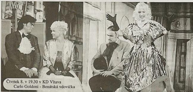
Čtvrtek 8. v 19.30 v KD Vltava Carlo Goldoni - Benátská vdovička