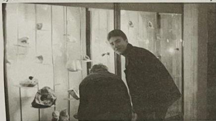
Mladí mineralogové při prohlídce Muzea Českého ráje v Turnově.