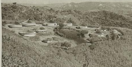
Domorodá vesnice kmene Zuluů v oblasti Natalu.

Naše cestování černým kontinentem začíná v Kapském Městě. Po mnoha měsících pobytu v tropických a subtropických oblastech