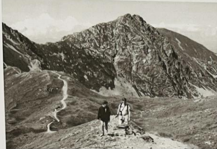
Roháče - výstup na Baranec.

uskutečnily se tři tábory. 1. - 11.7.1999 - stálý tábor na Puchverku, kterého se zúčastnili 42