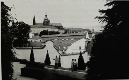
Jan Vacek - Pohled na Hradčany z Vrtbovské zahrady.