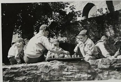
Na hradě Velhartice.

Letošní prázdniny prožily světlušky, nejmladší skautky ve věku 7 - 10 let, na táboře v obci Mezholety u Domažlic, kde plnily nelehké úkoly od krále Arnošta, panovníka z Pohádkové říše. K Pohádkové říši putovaly celý rok a sly po stopách prince Artura, který byl zakletý v žabáka. Zaklel ho Arnoštův zlý bratr Bereníš a krále Arnošta vyhnal z říše. Aby byla říše pohádek zachráněna, musely světlušky k říši přijít a během tábora složit Pohádkovou knížku, a tím zachránit Pohádkovou zemi. Ke každé pohádce plnily spoustu rozmanitých úkolů, které je posunuly blíže k vysvobození prince. Světlušky se ale nezalekly úkolů, knížku složily, předaly ji králi Arnoštovi, polibily podobiznu žabáka prince Artura, který se opět proměnil zpátky v prince a celou Pohádkovou říši tím zachránily. Na táboře nechyběly ani výlety do okolí, navštívily jsme Domažlice a jejich chodský hrad a muzeum Jindřicha Jindřicha. Prohlédly jsme si Koloveč, kde se točí chodské keramické nádobí a sbírku rozmanitých národních předmětů. Prošli jsme se po rodném domě Jana Sladkého Koziny v Újezdě. Jelikož nám počasí přálo, chodily jsme se i koupat, jak na koupaliště, tak i k potůčku, který protéká blízko nás. Děvčata si vyzkoušela stavbu chýší, vaření polévky na ohni, výrobu gobelínu a projela se i na koni. Večery