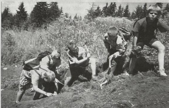
Na lokalitě hematitu u Bludné.

Předposlední den našeho pobytu v Nejdku jsme věnovali sběru nerostů na kdysi proslavené lokalitě horního města v Jáchymově, na zašlých haldách dolu Svornost. V odborné literatuře je odtud popsáno několik desítek nerostů. Z nich se nám po několikahodinové usilovné práci podařilo nalézt pouze kusový stříbrnělesklý skutterudit s povlaky narůžovělého erytrinu (minerálu arzenu a kobaltu). Přesto byl zájezd do tohoto slavného města světového významu pro nás užitečný. Prohlédli jsme si celou lázeňskou oblast města, která se za poslední léta velmi změnila, zejména výstavbou nových lázeňských ústavů Curie a Běhounek, pojmenovaných na památku významných radiologů. Navštívili jsme i nejznámější a nejstarší lázeňskou budovu, Radium Palace, na jejíž zdi je zasazena deska na paměť objevitelky rádia a polonia a nositelky Nobelovy ceny, Marie Curie, která navštívila Jáchymov v červnu roku 1925.