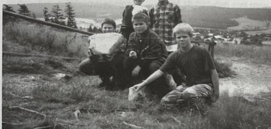
U ledových jam v Horní Blatné.

S troškou nostalgie vzpomínáme v období studené zimy na teplé slunné dny, kdy jsme na prázdninovém táboře denně vycházeli za nerosty Krušných hor na méně známé mineralogické lokality.