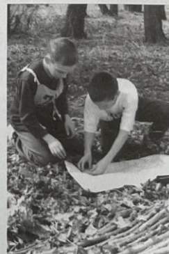
Na kontrole orientace mapy.

do seriálu závodů Českého poháru a odtud pak postup na Mistrovství České republiky.