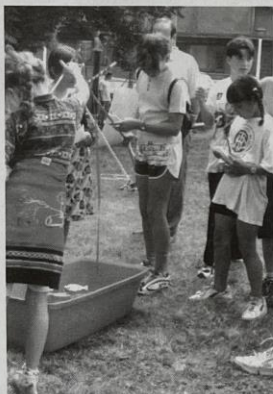
Dětský den 6.6.1999

V prvním měsíci roku - lednu, to byl tradiční "Zimní přechod Nedvězí", malebným Kokořínskem za krásného zimního počasí kráčelo 61 účastníků. V únoru to byla soutěž v uzlování a práci s lanem "Uzlařská regata". Svůj um s provazy zkoušelo 46 osob a byl zaznamenán i nový rekord - 6 základních uzlů za 31,90 sekundy. Koncem března se uskutečnil oblastní "přebor Turistických