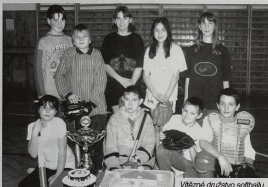
Vítězné družstvo softballu.