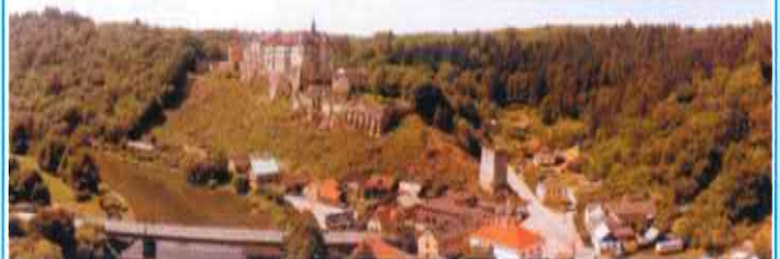
Mohutný hrad Český Šternberk hrdě se vypínající nad řekou Sázavou – první zastávka druhého zájezdu Sdružení.

Druhý letošní zájezd vede po trase Český Šternberk – Vlašim. Uskuteční se ve středu 13. června, kdy nejdříve navštívíme nejmohutnější hrad Posázaví – Český Šternberk. Tam uvidíme mimo jiné exponáty ze třicetileté války a Siň spoluzakladatele Národního muzea v Praze. Na zámku ve Vlašimi si projdeme muzeum Podblanicka a pak nastane toulka příjemným zámečným parkem. Přihlášky přijímáme v úterý 5. června od 14 hodin v Penzionu. Odjezd od KD Vltava v 7.00 hod., dále po obvyklých nástupních místech. Z otočky v Minicích v 7.30 hod. Předpokládán návrat kolem 18 hodiny.