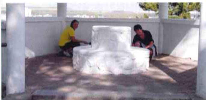
V rámci brigády se také natřela vyhlídka, oblíbené odpočívadlo „houbička“ a upravilo se okolí památníku.

Dne 6. června se uskuteční v KD Vltava od 18 hodin veřejné setkání se zpracovateli obou architektonických studií řešení centra města. Spolu se zastupiteli města a členy pracovní komise „Centrum“ se budete moci zeptat na vše, co Vás v této souvislosti zajímá.