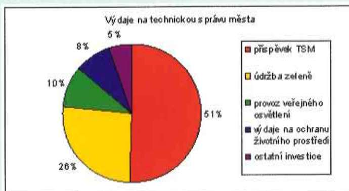
Graf č. 2

Poměr těchto výdajů je zachycen v následujícím grafu č. 2