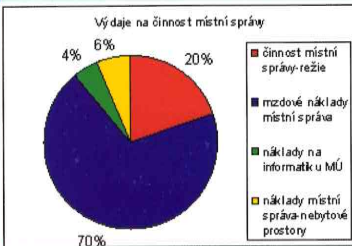
Graf č. 1

Poměr těchto výdajů je zachycen v následujícím grafu č. 1